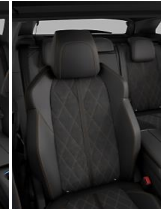
Alcantara® Mistral Gramloz