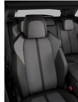
C&T Imila Mistral Tramontana