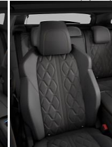
Cuero Nappa Mistral Amloz